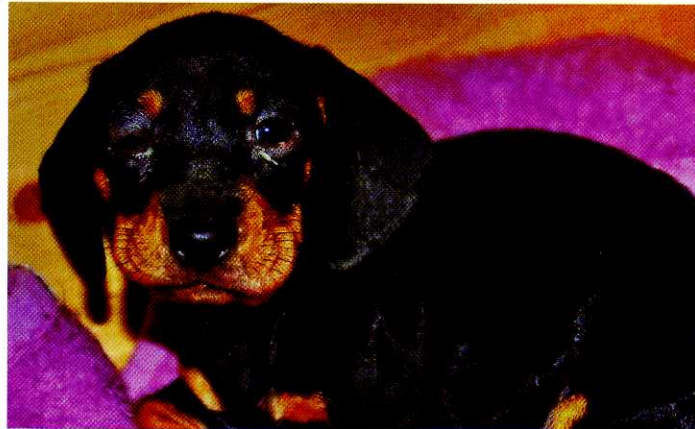
Abb. 1: Periorbitale Hautveränderungen

Ein sechs Wochen alter, weiblicher Kurzhaardackel entwickelte innerhalb eines Tages massive Gesichtsschwellungen und sichtbare Umfangsvermehrungen hinter beiden Kiefergelenken, nachdem am Vortag zunächst nur ein stecknadelkopfgroßer weißer Punkt am Oberlid des linken Auges sichtbar war. Er war laut Besitzer schläfrig und seit einer Woche appetitlos. Bei der klinischen Untersuchung wies der Welp auf ein reduziertes Allgemeinbefinden auf.