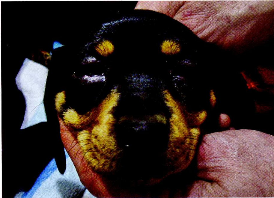
Abb. 3: Erkrankung eines weiteren Welpen aus dem Wurf. Ödematöse Schwellungen und Pustelbildung.

Besserung der Symptome. Wegen der zusätzlichen perakuten Verschlechterung des Allgemeinbefindens mit perinasalen und periokulären Schwellungen sowie Schwellung der Anogenitalregion und knotigen Verdickungen im Rückenbereich wurde der Welpen 6 Tage nach Therapiebeginn euthanasiert und eine pathologische Untersuchung durchgeführt.